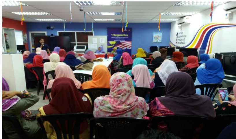
Gambar 2: Mesyuarat AJK Kelab Keusahawanita Hulu Selangor