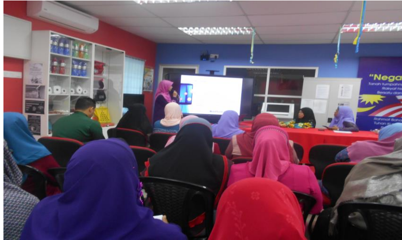
Gambar 1: Penolong Pengurus Pi1M Kalumpang sedang membentangkan Pengenalan Pi1M Kalumpang, My Shop, Dashboard Komuniti dan Klik Dengan Bijak.