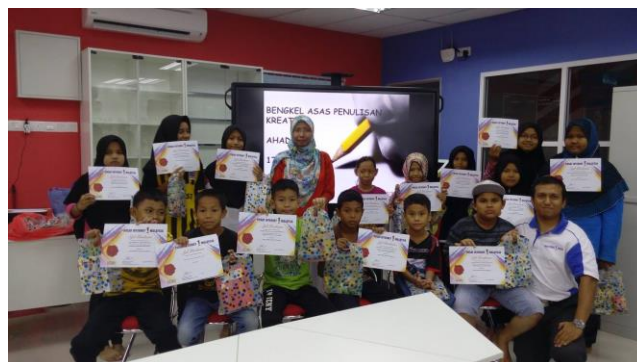
Gambar 4: Peserta bergambar bersama penceramah