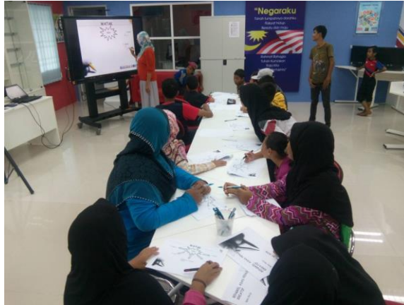
Gambar 2: Peserta mendengar taklimat yang diberikan oleh penceramah