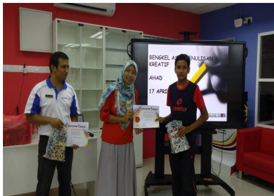
Gambar 3: Peserta menerima sijil penyertaan