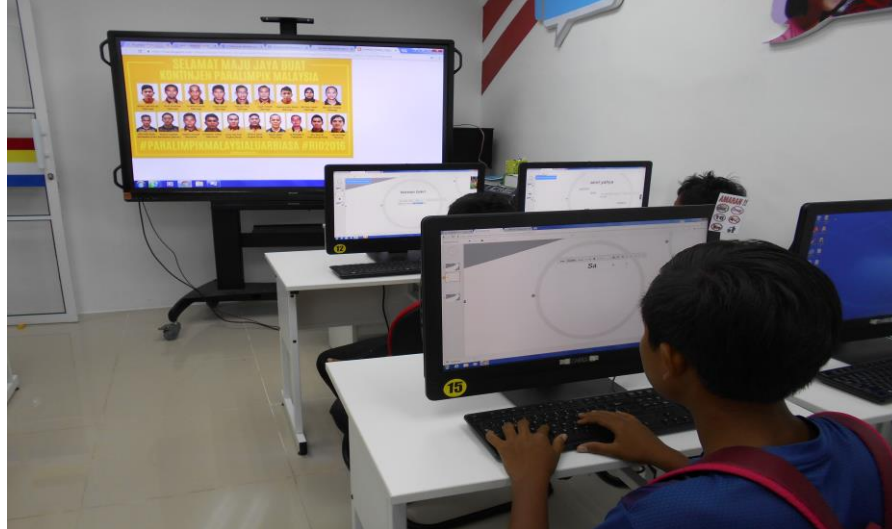
Gambar 2: Pengunjung dan Ahli Pi1M Kalumpang sedang membuat slideshows mengenai ahli sukan yang dipilih.