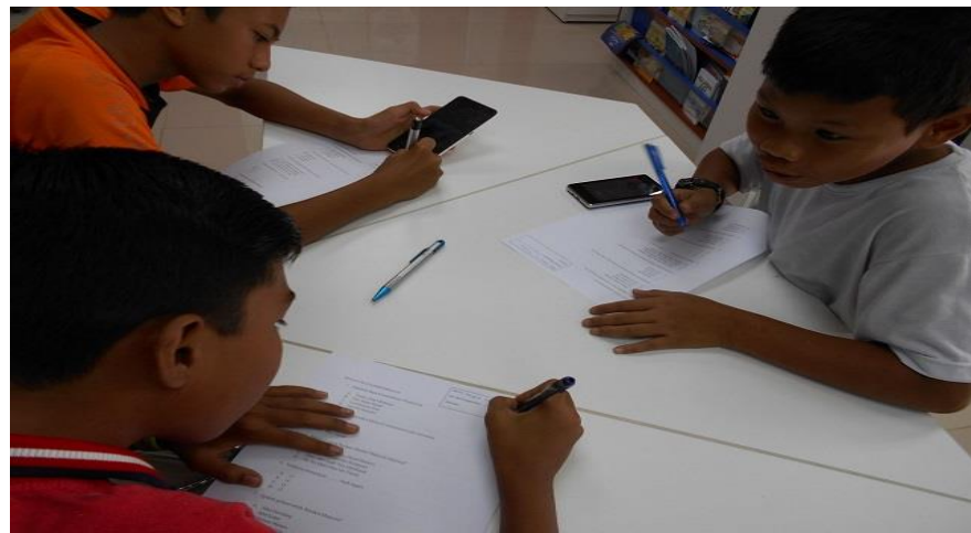
Gambar 2: Antara peserta yang memasuki pertandingan Kuiz Patriotik