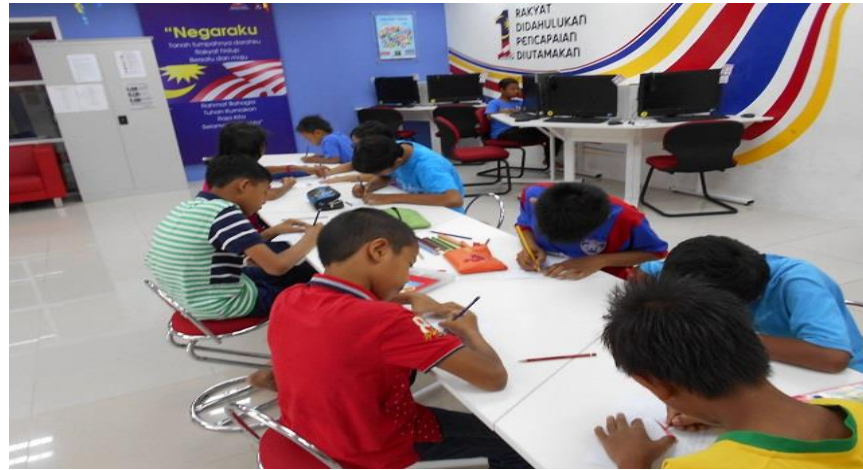
Gambar 1: Peserta sedang mengikuti Pertandingan Mewarna Sehati Sejiwa